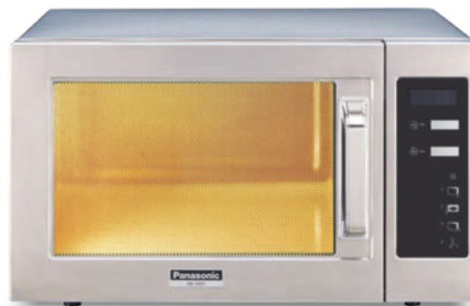
NE 1037 AUTO