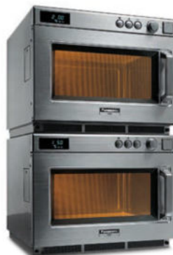
NE 1643 / 1843 / 2143-2