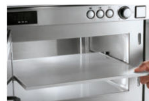
Secondo piano estraibile per i modelli NE 2143-2 e NE 2153-2

Removable intermediate shelf for models NE 2143-2 e NE 2153-2