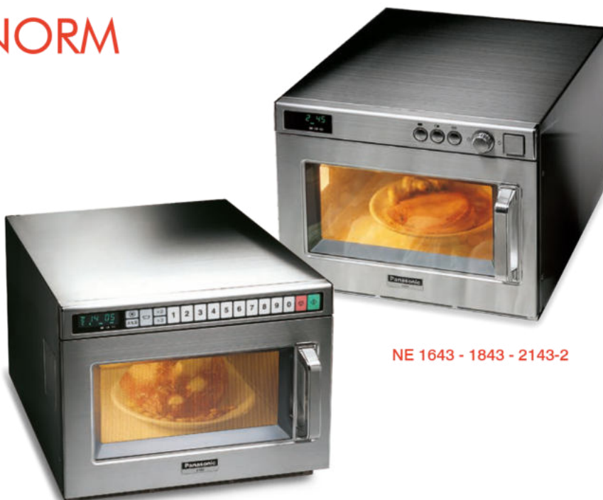
NE 1643 - 1843 - 2143-2